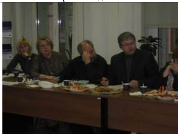
Участники делового завтрака 29 января 2012 года, посвященного новеллам законодательства, регулирующего деятельность некоммерческих организаций, вступившим в силу с 1 января 2012 года, а также ряду законодательных инициатив

За прошедшие полгода Филиал МЦНП и НП ЮГО также провели информационную встречу по неотложным вопросам некоммерческого законодательства. Так, 20 октября 2011 года состоялась информационная встреча, посвященная обсуждению проекта федерального закона «О внесении изменений в отдельные законодательные акты Российской Федерации по вопросам государственной регистрации и контроля деятельности некоммерческих организаций», подготовленного Министерством юстиции Российской Федерации, в которой приняли участие более 40 представителей российских и зарубежных некоммерческих организаций. Итоговый документ встречи был размещен на сайте ЮГО и направлен в Минюст России.